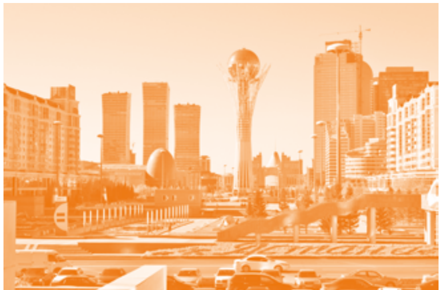
Die Innenstadt von Astana mit dem Bajterek-Turm in der Mitte