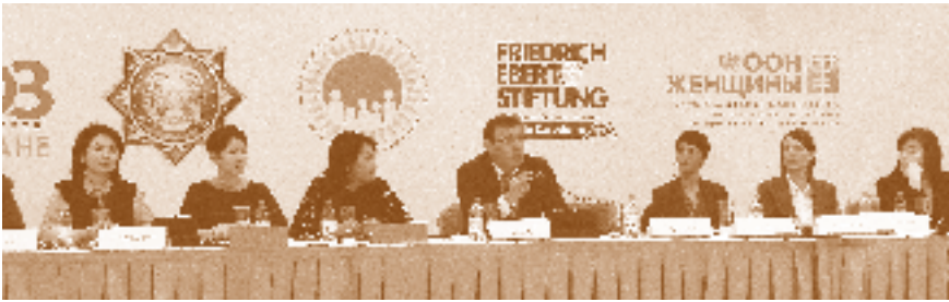
Das Podium beim Nationalen Ausschuss für Frauen und Familienpolitik beim Präsidenten der Republik Kasachstan