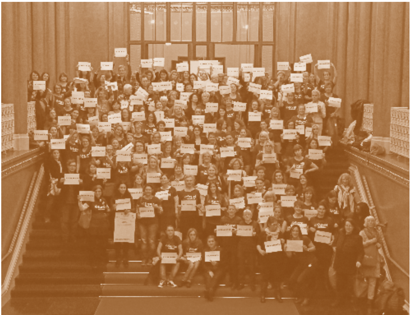
Teilnehmende der WAVE-Konferenz im Foyer des Roten Rathauses in Berlin