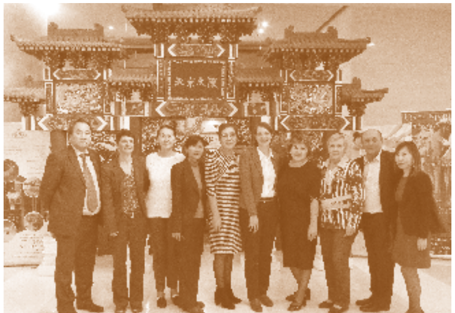
Teilnehmer*innen des Runden Tisches „Soziale Partnerschaften im Interesse der Frauen und Kinder“ am 7. Oktober im Foyer des Hotel Beijing Palace Soluxe in Astana

Am Ende der Sitzung findet eine Preisverleihung anlässlich des 25.